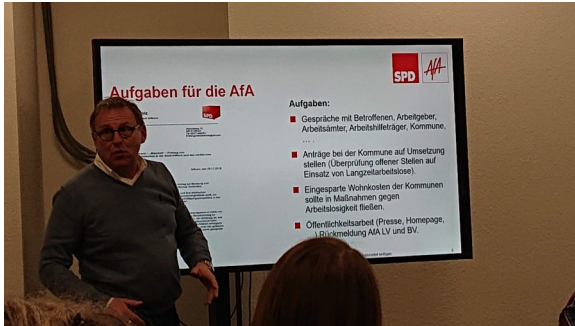
18. Januar 2019 / AfA Treffen in Hannover